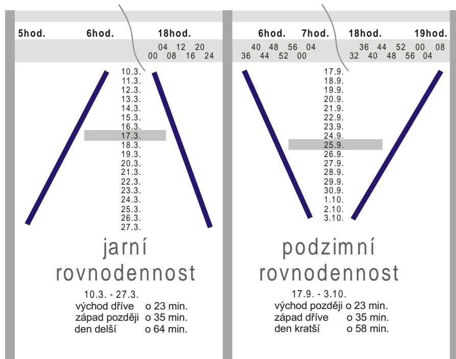
Graf zpracoval Petr Dubjak