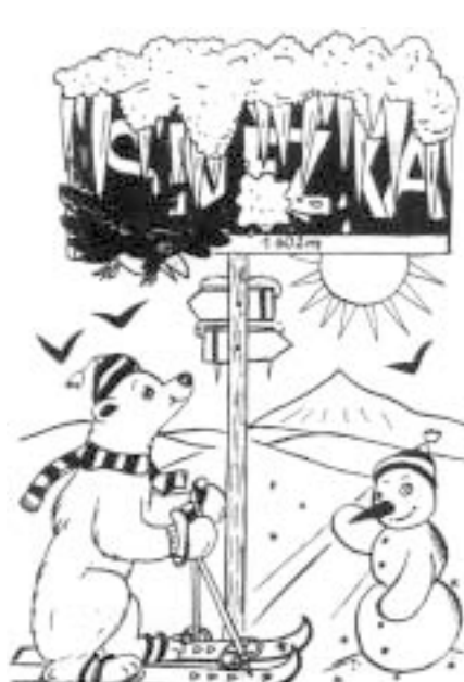
KAMPAK SE ASI CHYSTÁ MIŠA LYŽOVAT?