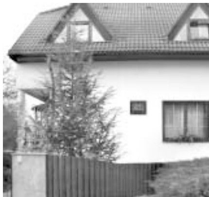
V rámci seriálu křížky a pomníky – letošní únor a březen je výroční pro Antonína Opálku, který má pamětní desku na rodném domku na Lípové ulici.