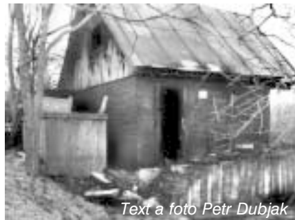
Text a foto Petr Dubjak

V pátek 8. března ve večerních hodinách se v obci roznesla fáma, že nad Ostopovicemi hoří les. Z mnoha míst byly vidět mezi stromy plameny. Obětí se stala chata těsně za vrcholem Přední hory. Díky všem, kdo volal na 150 a tím pomohli zachránit okolí požáru.