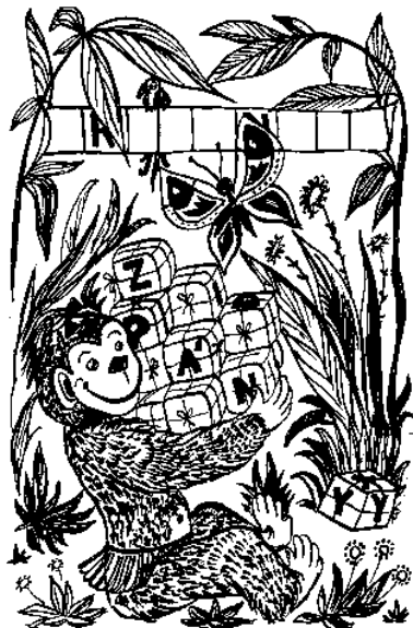
OPIČKA „RÉBUS“ PŘINESLA DĚTEM: .....