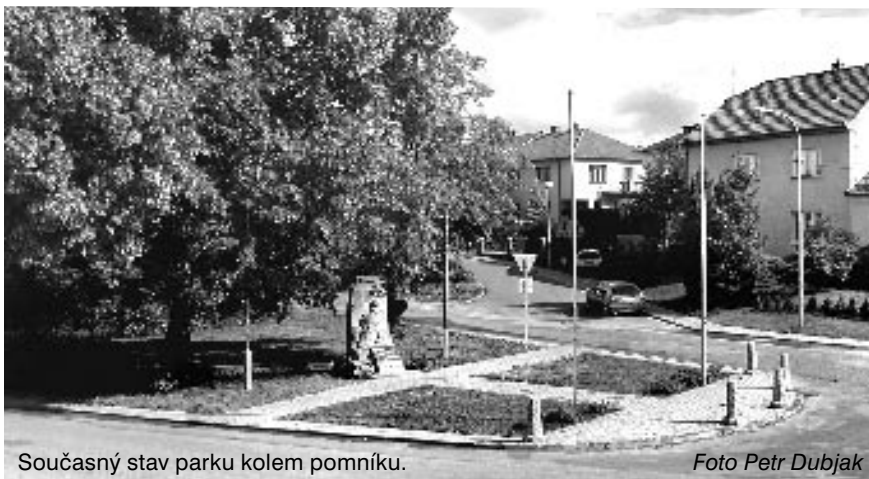
Současný stav parku kolem pomníku.