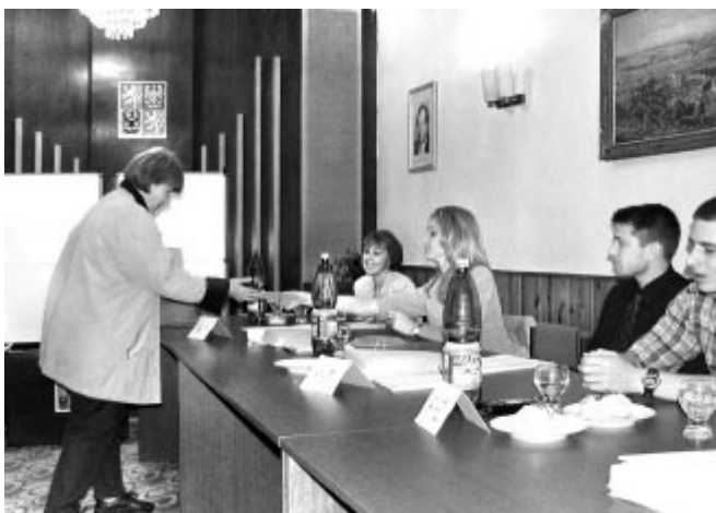
Komunální volby 2002