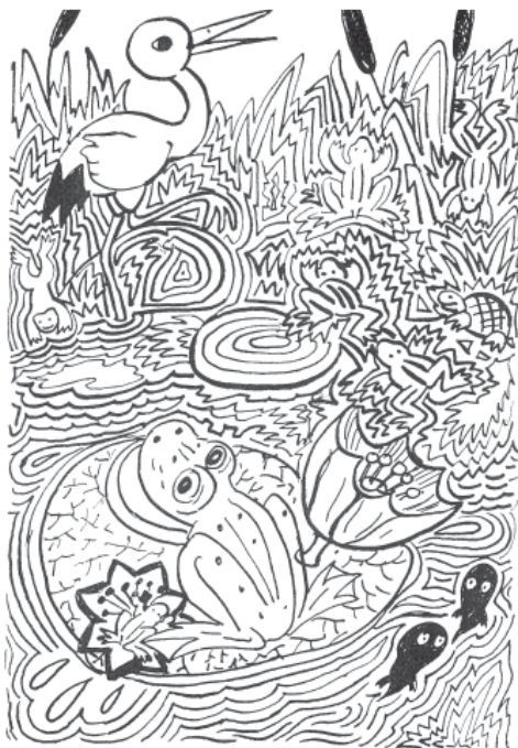
SPOČÍTEJ, KOLIK ŽAB SE UKRYLO PŘED ČÁPEM!