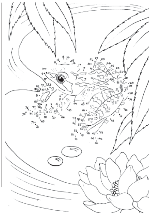
SPOJENÍM ČÍSEL ZÍSKÁTE ZAJÍMAVÉ OBRÁZKY