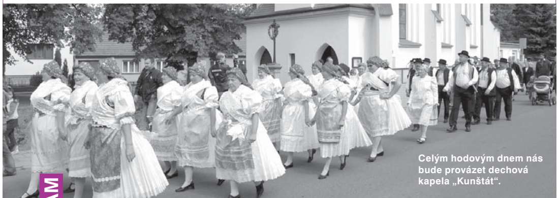
Celým hodovým dnem nás bude provázet dechová kapela „Kunštát“.