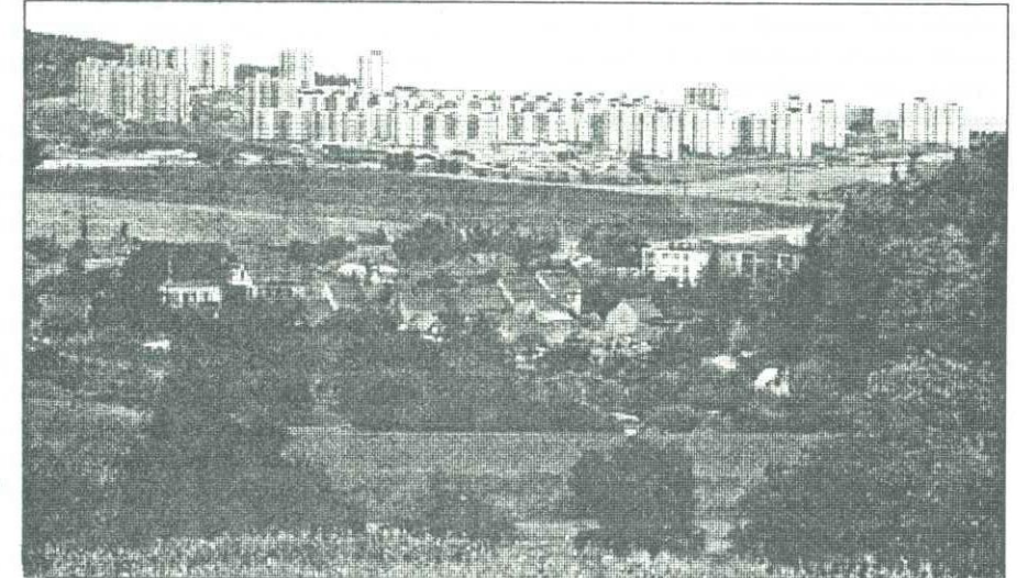
Současné Ostropovice pod úbočím Přední hory, v pozadí Bohunické aglomerace

Bezmála půldruhé tisíce ostropovických rodáků a usedlíků před pěti léty, v úctě a s projevy uznání, zavzpomínalo na dávný původ své obce. Se spontánní srdečností všichni oslavili sedmistépadesáté výročí údajného počátečního vstupu do historie.