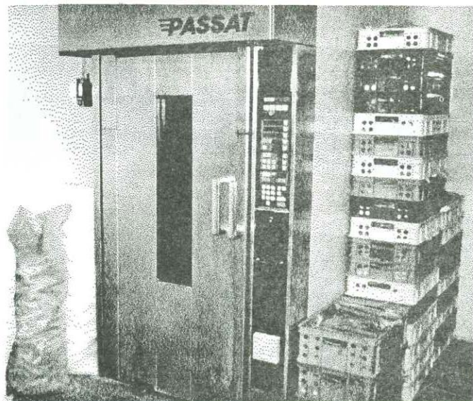
Moderní pekařská pec.

Možná jste si zvykli už i na malou, ale dobře vybavenou prodejnu, která patří k objektu. Pracuje zde prodavačka, ale mimo otevírací dobu vás na zazvonění obslouží přímo